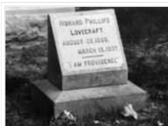
"Yo Soy Providence"

En 1924 se casa con Sonia Haft Greene, empleada en la United Amateur Press Association y siete años mayor que él, separándose de ella dos años después. Los motivos que Lovecraft argumenta para justificar la separación, son las grandes divergencias entre ambos y los problemas económicos... aunque también existen rumores -desmentidos por Sonia- sobre su horror a las relaciones sexuales. Tras la estancia en Brooklyn de dos años, Lovecraft retorna a Providence, donde vivirá con sus tías. Ya en Providence, se ve superado por la sensación de fracaso que lo rodea, abandonándose a la soledad y la frustración. En esta época disfruta de paseos nocturnos, que repercuten en su hundimiento personal, y crean una esfera invisible de miedos que nunca le permitirán recuperarse.